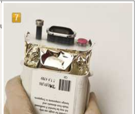
HP 940 Tintenbeutel in Patrone einsetzen