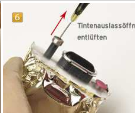
HP 940 Tintenauslassöffnung entlüften